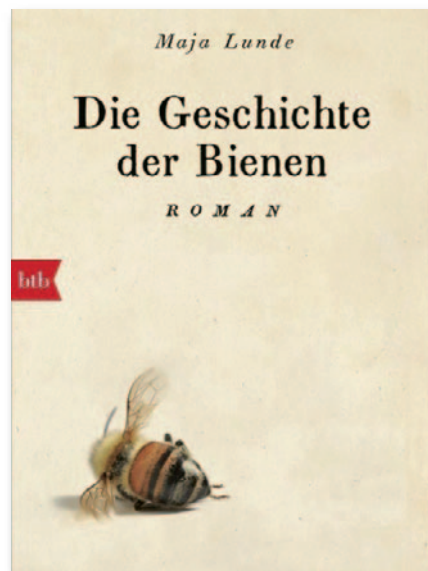
Die Geschichte der Bienen von Maja Lunde (09/2018), btb Taschenbuch, € 11,40