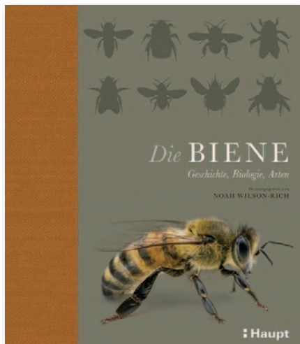
Die Biene von Noah Wilson-Rich (02/2015), Haupt Verlag AG, € 30,80

Empfehlung, die mir persönlich sehr gut gefallen: