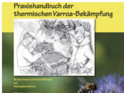
Praxishandbuch thermische Varroa-Bekämpfung , Wolfgang Wimmer, Eigenverlag, € 12,00